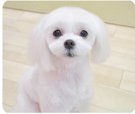
こむぎ (マルチーズ)

こむぎは、とつてもわんぱくですが、さみしがりの一面もあります。家族がみんな揃っている時には、お気に入りのおもちゃ（パ