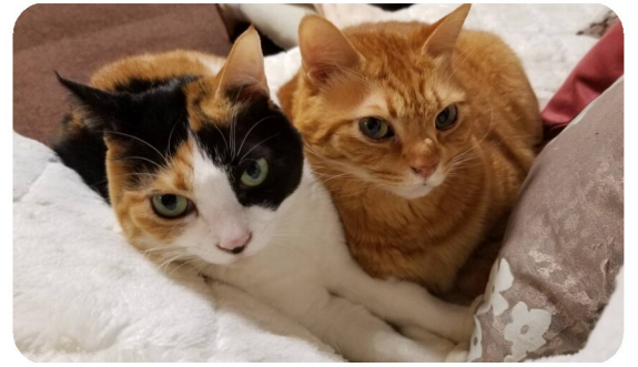
さくら・とらじろう (三毛猫・トラ猫)

ママは渋々OKを。餌やりと電気は子供が。パパは水替え担当を。出かける時は「行ってきます」「ごはんだよ」「めだかさん、ただいま」「おやすみ」等声かけも上手になりました。お手伝いの声かけをすることで、してくれるのですが、言わなくてもしてくれる様になって欲しいですね。水槽は最初はきれいだったのですが、今は水草がどんどん成長してジャングル状態になってしまいました。わが家の朝は今日も「めだかさん、おはよう」から始まります。