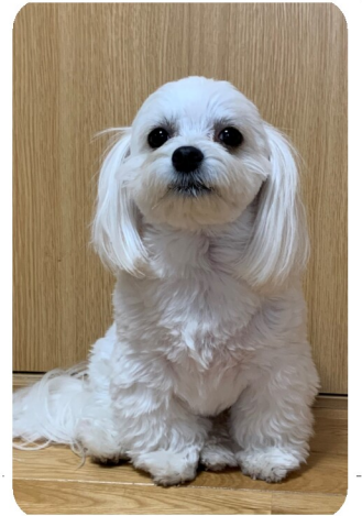
ラム(マルチーズ×チワワ)

ラム君はミックス犬(マルチーズとチワワ)です。わが家では三代目になりました。皆さんと同様に大切な家族となっています。一代目はマルチーズで15年間、二代目はチワワで14年間