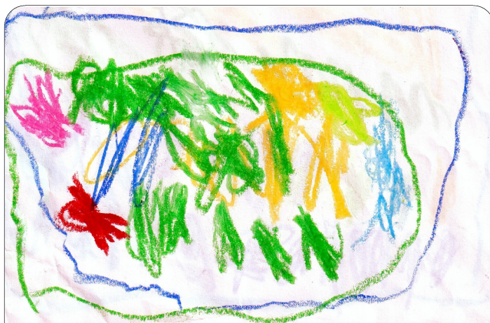
岩屋堂の川遊び 倅大くん (5歳)