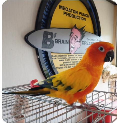
ぴーちゃん(黄金メキシコインコ)

我が家に来て二年、フィリピン生まれの男の子です。しゃべります、肩にのります。今年から六畳の小屋に一匹住まい、広くて飛び回って大喜びしています。ヒマワ