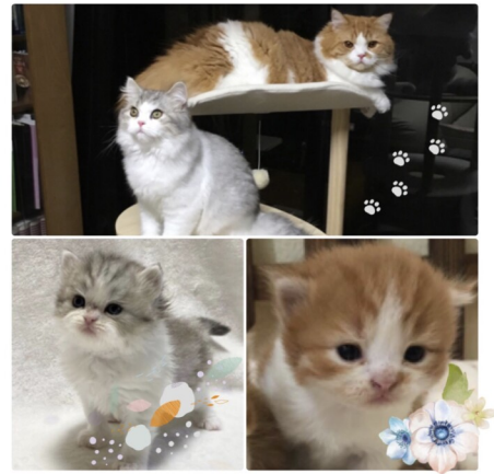
むぎ茶(マンチカン) まめ茶(スコティッシュフォールド)