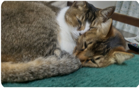
タマ・ミイー (ミックス)