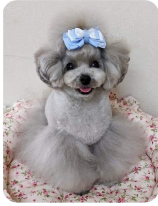
パル(トイ・プードル)

我が家の5匹の愛犬の1匹、トイプードルのパルです。1.8センチの小さな男の子。トリミングサロンの看板犬で、人もワンコもみんな大好き！リボンモデルも