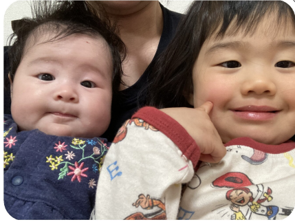
ちゃん 2歳 ちゃん 3ヶ月 ちゃん 2歳 ちゃん 3ヶ月