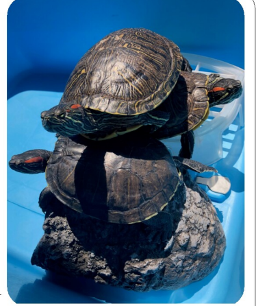
かめ吉・かめ代・かめ丸

我が家はアカミミガメが、家族として3人います。かめ吉、かめ代、かめ丸です。うちに来てはや10年になります。かめ代はペットショップで、