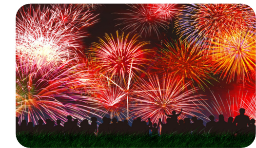
引用 「尾張旭の地名」 尾張旭市教育委員会発行

五反田：旭中学校の北側にこの地名が残っている。○反田という地名は全国的にもよくあるもので、五反の田があつた所を指して呼んだ地名であろう。新居本郷の集落の北側に今池から水を引いた用水が通っていた。この用水の水を使って耕作をしていたと考えられる。現在は、用水の一部が瀬戸・新居線の下に隠れてしまった。向前三：江戸時代の「島」の中の一つに向島があつた。向島は新居本郷の南にあり、今の旭中学校を中心とした辺りの集落であろう。向島の前（南）を指した地名であると考えられる。五輪塚：五輪塚とは五輪塔を祀った塚のことである。以前、旭中学校の運動場南辺りにあつたという。この五輪塔の塚にちなんで地名が付けられた。現在では、五輪塔だけが旭中学校の南東の端に移されている。五輪塔として伝わっているが、実際は宝篋印塔と呼ばれる塔である。年代が確認できるものの中では、市内最