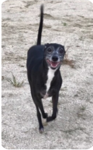
エレナ（イタリヤングレーハウンド）

はじめまして！私は末っ子のエレナ！家族は私の事「えつ子・えつちゃん・エレ・エツ」なんて、色々な呼び方するの。でもすぐ私の事って分かるの！私に